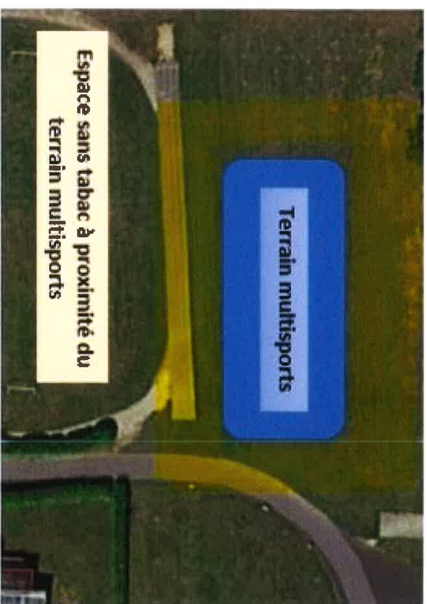
Espace sans tabac à proximité du terrain multisports