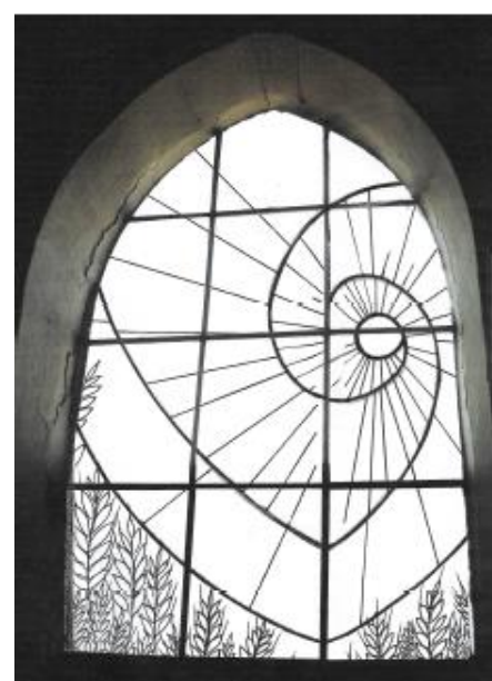
Projet de création