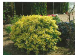
Choisya ternata sundance