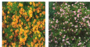
Potentille fruticosa hoppley et princess