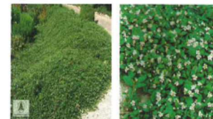
Cotoneaster dammeri major