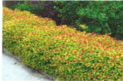
Spirée gold flame