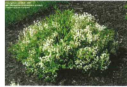
Deutzia crenata nikko