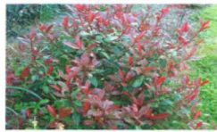
Photinia red robin