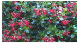
escallonia compacta coccinea