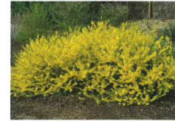
forsythia marée d'or courtasol