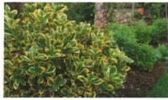
Euonymus japonica aureomarginata