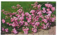
Rosier the fairy