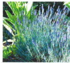
Lavande richard grey